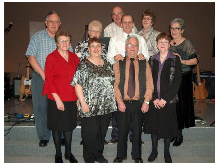
lors de la Soirée des Fêtes de l'Âge joyeux le 9 janvier 2010 à Montbeillard