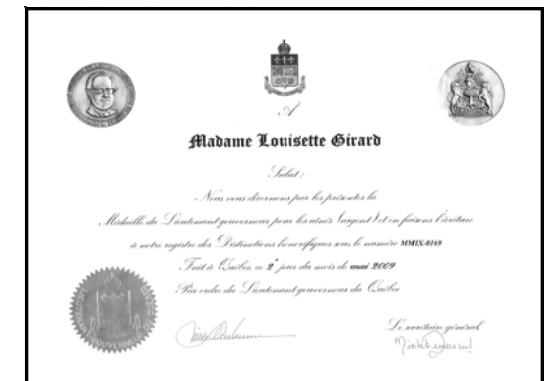
Certificat de reconnaissance

Félicitations pour votre implication extraordinaire.