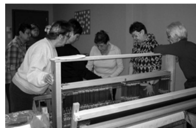
Photo : Atelier de tissage