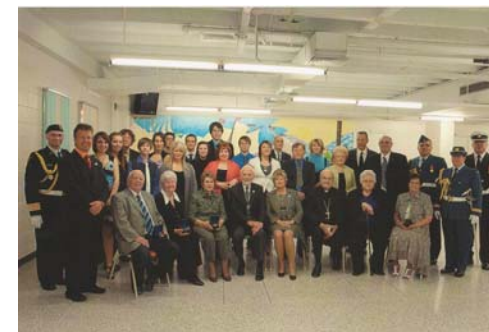
À gauche : Groupe présent lors de la remise de la médaille