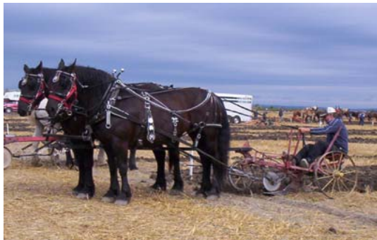
Alain Héroux, laboureur