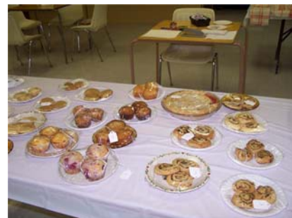
Arts culinaires muffins tartes- biscuits