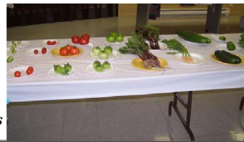
Culture de légumes