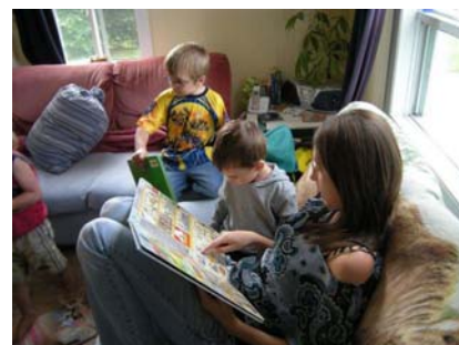
La Trotteuse biblio