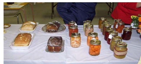
Arts culinaires pains et conserves