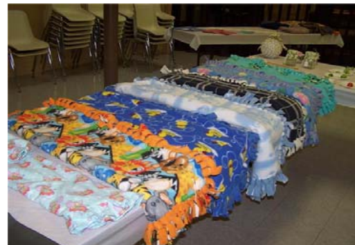
Doudou—Un petit cœur au chaud