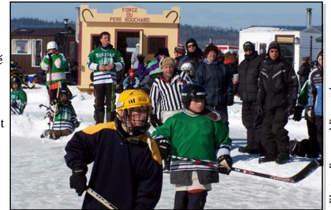
Des jeunes évoluaient constamment sur la patinoire centrale.

Ceux qui ont vécu le samedi 23 février 2008 sur l'Opasatica à Montbeillard ne l'oublieront pas de sitôt. Pour garer sa voiture en début d'après-midi on n'avait d'autre choix que de se ranger sur l'accotement de la grande route. Depuis le matin, pour deux voitures qui sortaient deux, puis quatre puis six entraient. Au point où on ne savait plus vraiment où les mettre. Les profits de la vente de billets pour divers tirages ont été assez importants pour permettre à l'organisation de s'en tirer sans déficit aucun. Dans les circonstances décrites, c'est de la haute voltige. Le prix le plus convoité, un VTT Polaris 500, a été gagné par une jeune fille de Montbeillard résidant depuis peu à Saint-Faustin dans les Laurentides. Le billet lui avait été offert à Noël par sa mère qui, par un fort beau hasard, a participé activement aux préparatifs en tant que bénévole.