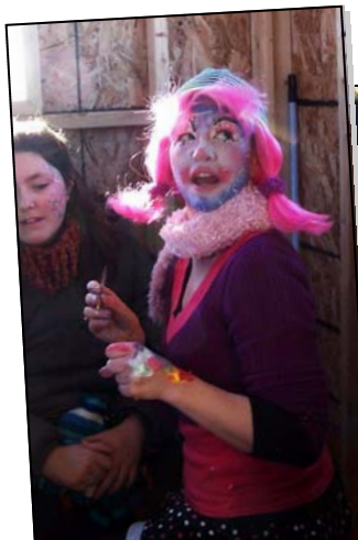
Les maquilleuses, tout sourire, en avaient plein les bras.