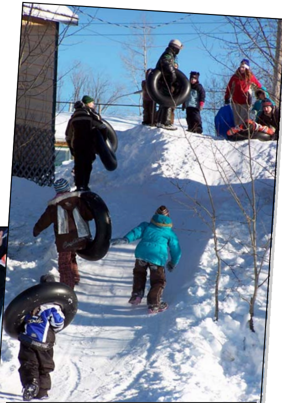
La glissade infernale n'a pas dérogie, on ne s'en lassait jamais.

Des gens de Laniel tenaient cabane à sucre et les queues de clients étaient constantes. D'autres qui assuraient des services de restauration sur place y ont fait de très bonnes affaires. De fait, si les marchands des alentours ne leur avaient pas prêté main-forte, ils auraient été en rupture de stocks.