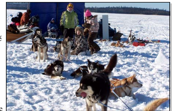
Un Musher montrait ses chiens de traîneaux aux festivaliers.

Les membres du Comité Sports et Loisirs de Montbeillard qui ont fait le pari de réussir un si grand rassemblement, avec la contribution financière du Pacte Rural de Rouyn-Noranda, l'ont gagné. Y a-t-il une leçon à en tirer ? Oui, si nous avons tant apprécié la visite des gens de toute la MRC lors du premier Opasatica village sur glace on doit rendre la politesse à ceux qui sont venus en les visitant chez eux lorsqu'ils organisent un grand événement. Plus on est nombreux plus on s'amuse.